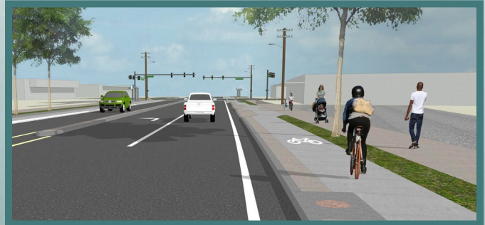
Ilustración de la bicisenda a nivel de la acera.